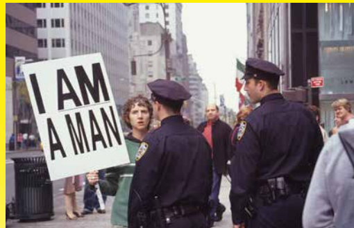
Sharon Hayes, In the Near Future , 2009.