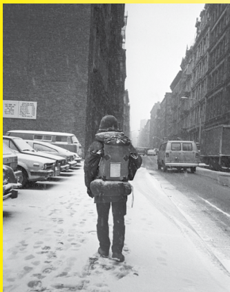
Tehching Hsieh, One Year Performance, 1981 – 1982, New York.

Il mio processo di ripensamento della relazione con gli attori, con la performance e con la condizione di spettatore è stato agevolato da alcune opere, in particolare Following Piece di Vito Acconci, nella quale l’artista segue alcune persone incontrate per strada a New York fino a quando queste entrano in uno spazio privato 1 ; Roberta Breitmore di Lynn Hershman Leeson, nella quale l’artista crea, registra e vive di fatto un’identità totalmente nuova a San Francisco; Outdoor Piece di Tehching Hsieh, che lo vede rifiutarsi di entrare al chiuso per un anno intero; e The Mythic Being di Adrian Piper, nella quale l’artista, una donna, si traveste da uomo e porta la sua nuova identità nelle strade di New York e di Cambridge. All’epoca della loro esecuzione, tutti questi lavori 2 sono passati inosservati e,