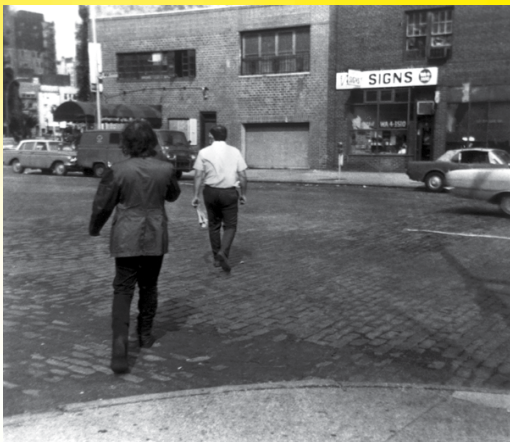
Vito Acconci, Following Piece , 1969.