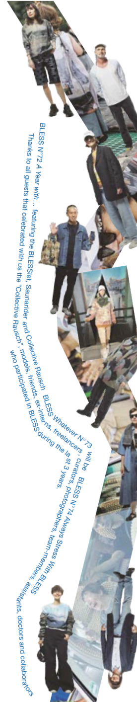
BLESS N°72 A Year with... featuring the BLESS! Saunander and Collective Raaserh. BLESS Whatever N°73 will be BLESS N°74 Always Stress With BLESS creators, photographers, team-members, assistants, doctors and collaborators. Thanks to all guests that celebrated with us the "Collective Raaserh" in 2023. "I hope so, in 2024, I will be 31 years old."