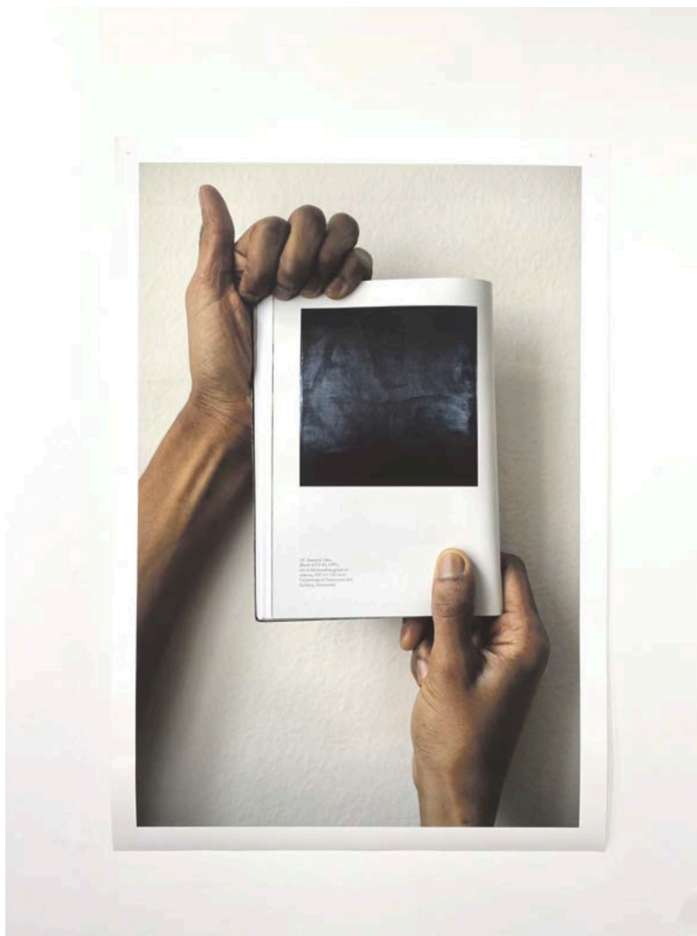
ID_012 Jimmy Robert, Joie noire , 2019. © Jimmy Robert Courtesy of the artist; KW Institute of Contemporary Art, Stigter van Doesburg, and Tanya Leighton Gallery